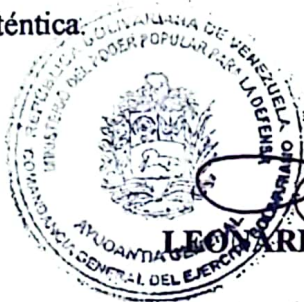
LEONARDO ANTONIO TRUJILLO CORDERO General de División Ayudante General del Ejército Bolivariano