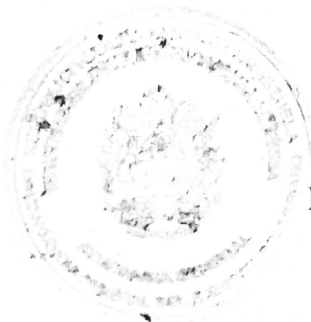
LEONARDO ANTONIO TRUJILLO CORDERO General de División Ayudante General del Ejército Bolivariano