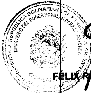
FÉLIX RAMÓN OSORIO GUZMÁN MAYOR GENERAL

COMANDANTE GENERAL DEL EJÉRCITO BOLIVARIANO RESOLUCIÓN MPPD N° 041362 DE FECHA 07JUL21 GACETA OFICIAL N° 42.174 DE FECHA 22JUL21