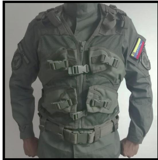
Tropa Profesional y Tropa Alistada